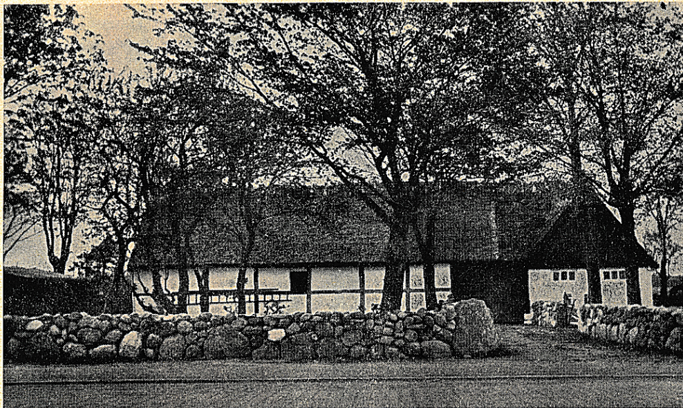
Bygården i Tomelilla